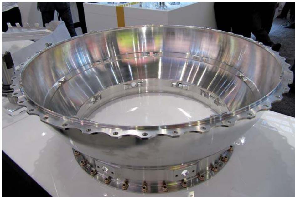
Een turbinehuis van de legering Inconel 718 getoond door gereedschapsleverancier Walter tijdens de AMB 2010