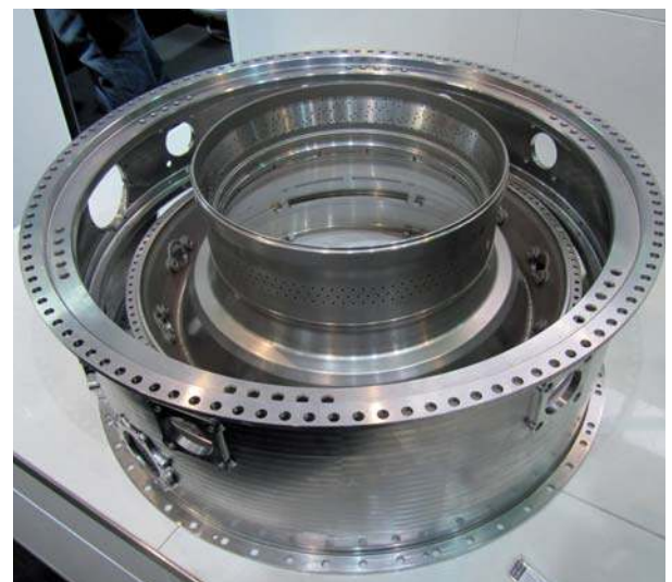
Nikkel wordt gebruikt bij de productie van roestvast staal en hoogwaardige nikkellegeringen. Op de foto een compressorhuis van CrNi-staal zoals door DMG getoond tijdens de AMB 2010. Dit is een werkstuk voor aerospace toepassingen met een diameter van 700 mm dat in 17 uur en 20 minuten verspaand is

maanduidingen met elkaar zo goed mogelijk overeen komen. Tabel 5 geeft de fysische eigenschappen weer en tabel 6 de mechanische eigenschappen.