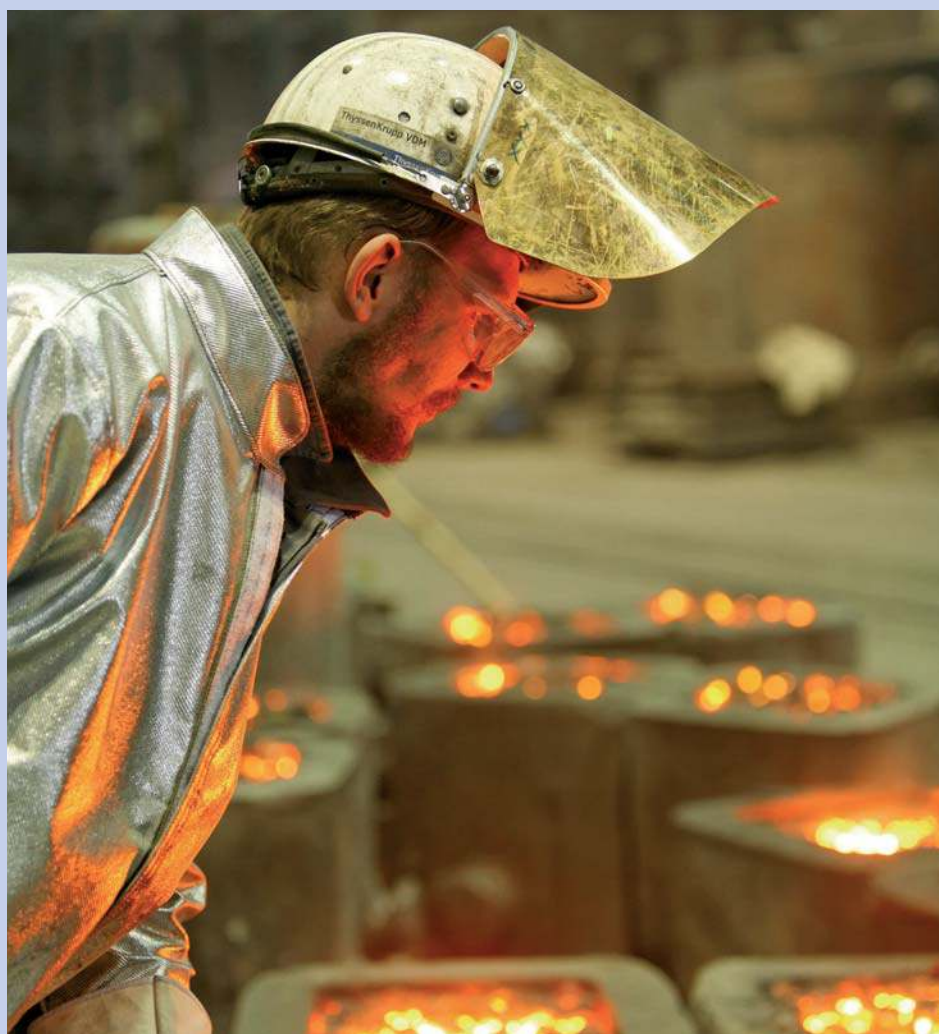
Het verwerken van nikkel tot legeringen bij ThyssenKrupp. Nikkel wordt veel als legeringselement gebruikt in voornamelijk ijzer- en koperlegeringen

Nikkel wordt als erts op vele plaatsen in de aardbodem gevonden doch het is slechts op een beperkt aantal vindplaatsen rendabel om dit erts te delven zoals bijvoorbeeld in Canada, Noorwegen en Nieuw Caledonië. Goede ertsen bevatten slechts 1,2-5% nikkel. Een veel voorkomende ertsamenstelling bevat circa 40% \text{SiO}_2 , 20% \text{MgO} , 15% \text{Fe}_2\text{O}_3 , 10% \text{H}_2\text{O} , 10% \text{NiO} , 1% \text{Al}_2\text{O}_3 , 0,7% \text{MnO}_2 , 0,2% \text{CoO} en 0,1% \text{CaO} .