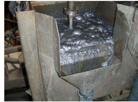
Een opname gemaakt van de bereiding van molybdeen. Dit metaal verhoogt de mechanische waarden van staal

Molybdeen is een metaal met een hoog smeltpunt en een dichtheid van 10.200 kg/m 3 . Het meeste van al het wereldwijd geproduceerde