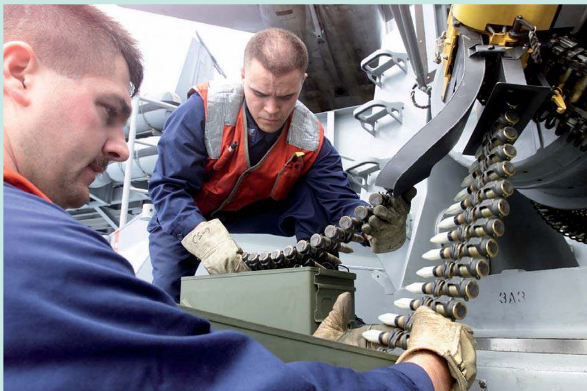
Eén toepassing van wolfram is als pantsermateriaal en omhulsels van kogels en granaten omdat de hardheid bij hogere temperatuur behouden blijft

Onderstaand een opsomming van diverse 'exoten' die in de metaal toch meer worden gebruikt dan men veelal aanneemt. In deze summier opgave enige relevante kenmerken en vooral toepassingsgebieden.