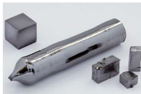
Een enkelkristal tantaal met daarnaast een kubus tantaal van 1 cm 3 . De oxidehuid is uitzonderlijk resistent

Dit artikel is geschreven door N.W. (Ko) Buijs van Innomet. Voor de levering van metalen als Ti, Zr, Ta, Nb, W, Ni, en Mo is Innomet een samenwerking aangegaan met het Chinese bedrijf Xi'an Refractory & Precise Metals Co. Ltd. Meer informatie via www.innomet.nl en www.refractorymetals.cn .