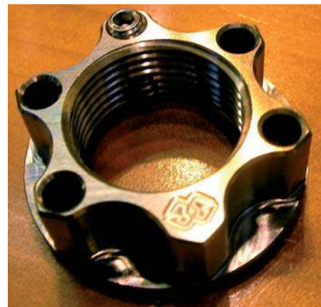
Een titaan-moer voor de achteras van een motorfiets van de legering Ti6AlV4, met een eigen massa van maar 20 g. Dit onderdeel wordt op het internet aangeboden met een prijs van 50 pond sterling (bron: www.superbike.co.uk )