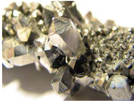
Kristallen niobium. Niobium is goed bestand tegen natriumdampen bij hoge temperaturen en drukken

Nikkel is een metaal dat een relatief hoge ductiliteit heeft dankzij de vele glijvlakken in het atoomrooster. Specifieke voordelen van het metaal nikkel zijn naast de zeer goede corrosiebestendigheid, de constante magnetische permeabiliteit, de geringe thermische uitzetting en de zeer goede eigenschappen bij hoge temperatuur. Het wordt ook vaak als legeringselement gebruikt in voornamelijk ijzer- en koperlegeringen. Voorbeelden zijn onder meer austenitisch roestvast staal, duplex, cunifer, cupronikkel en aluminiumbrons. De dichtheid is 8890 kg/m 3 . Nikkel wordt naast de commerciële zuivere uitvoering ook veel toegepast als gelegerd nikkel, dat verkrijgbaar is in alle productvormen. De lasbaarheid is uitstekend mits de juiste lasparameters worden gebruikt. Nikkel staat ook bekend vanwege haar zeer goede kruipvastheid. In de ongelegeerde conditie is het nikkel zeer goed toe te passen in bepaalde procesapparatuur en daarom zijn er twee ongelegeerde kwaliteiten