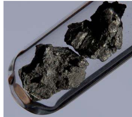
Stukjes zirkoon met een massa van 2,5 g en ongeveer 1 cm groot. Zirkoon is een hart met een grijszilver uiterlijk

Dankzij het hoge atoomnummer is het geschikt als anodemateriaal in een röntgenbuis. Vanwege het zeer hoge smeltpunt wordt wolfram gebruikt als gloeidraad in de bekende gloeilamp