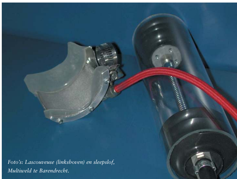
Foto's: Lascoueuse (linksboven) en sleepslof, Multiweld te Barendrecht.

Ja, titaan is onder bepaalde condities te solderen. De belangrijkste toepassing van het solderen van titaan is de fabricage van de honingraatstructuur voor de vliegtuigindustrie. Een behoorlijk probleem bij het solderen van titaan is de grote snelheid waarmee titaan met het gesmolten soldeer