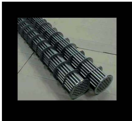
Titaankorven en titaan warmtewisselaars.

Met het lassen van meerdere lagen moet men erop toezien dat de temperatuur van het zirkoon niet teveel oploopt, want anders moet men het gebied wat gasbescherming nodig heeft verder uitbreiden. Omdat zirkoon uiterst gevoelig is voor contaminaties met verbrossing tot gevolg, is het van groot belang dat er lascontroles worden gedaan om zeker te zijn dat het lasproces goed is verlopen. Tijdens het lassen kan de lasser al de nodige controles uitvoeren en aanvullend kunnen er allerlei non-destructieve tests worden gedaan, zoals ultrasonoor en radiografisch onderzoek alsmede een liquid penetrant inspectie. Een metallische zilverkleur op het uiterlijk van de las geeft alleen aan dat de gasbescherming tijdens het afkoelen goed is verlopen maar het betekent nog niet dat de primaire gasbescherming bij de lastoorts goed is verlopen. En licht strogeel of lichtblauw regenboogachtige kleuren geeft aan dat de las is beschermd tot een temperatuur onder de 550°C. Deze kleuren moeten weggeborsteld worden voordat men het lassen gaat voortzetten. Onderstaande opsomming over de kleuren geeft een indicatie van de contaminaties weer: