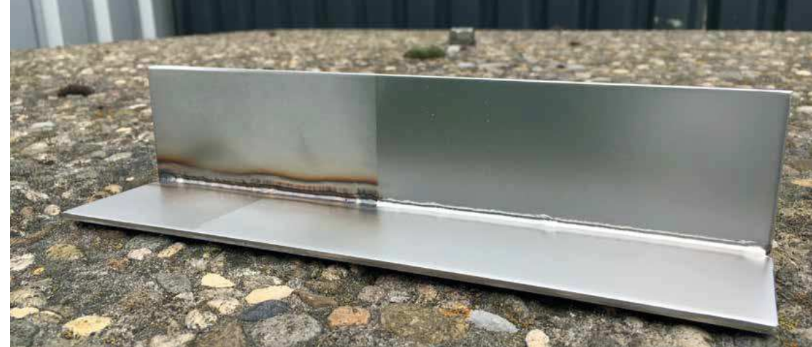
De rechterhelft is behandeld met PureFinish.

Hieronder volgen adviezen voor het gebruik van roestvast staal AISI304 in buitentoepassingen, afhankelijk van diverse oppervlaktebehandelingen.